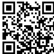
どんぱんかえしばやし